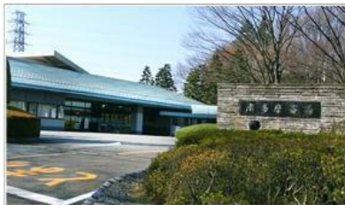
東京都町田市小山田町2147番地