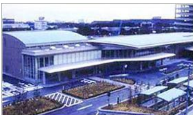
東京都大田区東海1-3-1